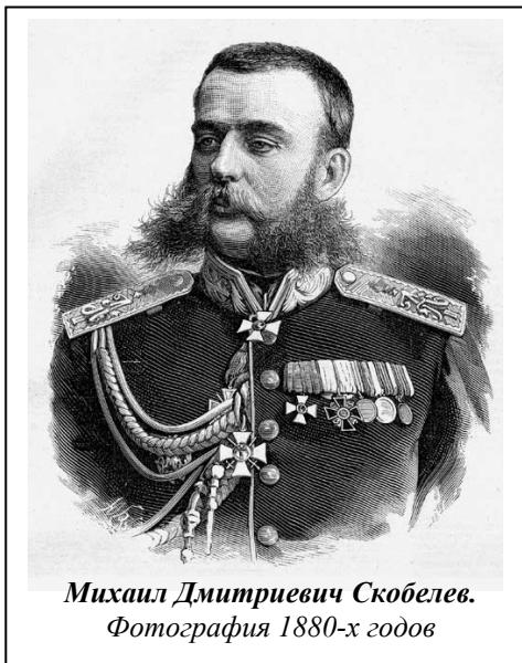
Михаил Дмитриевич Скобелев. Фотография 1880-х годов